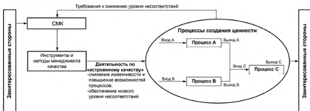
Рисунок 1 — Применение менеджмента качества при производстве продукции/оказании услуг

ствующей продукцией не останавливали и не замедляли процессы, составляющие поток создания ценности (см. рисунок 1).