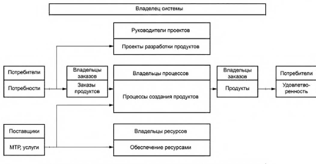
Рисунок 4 — Схема выполнения внешнего заказа в организации

5.8.1 Обобщенная схема выполнения внешнего заказа в организации и связанная с ним ответственность представлены на рисунке 4.