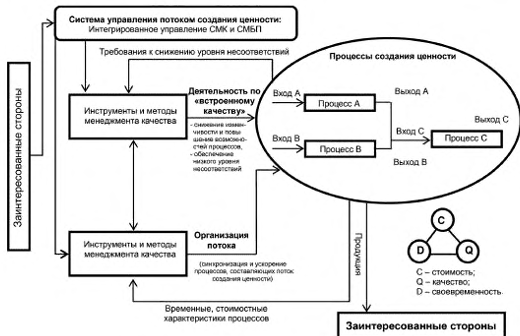
Рисунок 3 — Модель интеграции СМК и СМБП для управления потоком создания ценности

На уровне системы менеджмента интеграция СМК и СМБП осуществляется через создание единой системы управления выходными характеристиками ПСЦ, обеспечивающей планирование, реализацию, контроль и улучшение ПСЦ (продукции и/или услуг) с необходимыми характеристиками качества, стоимости и времени потока продукции в соответствии с требованиями потребителей и других заинтересованных сторон организации (см. рисунок 3).