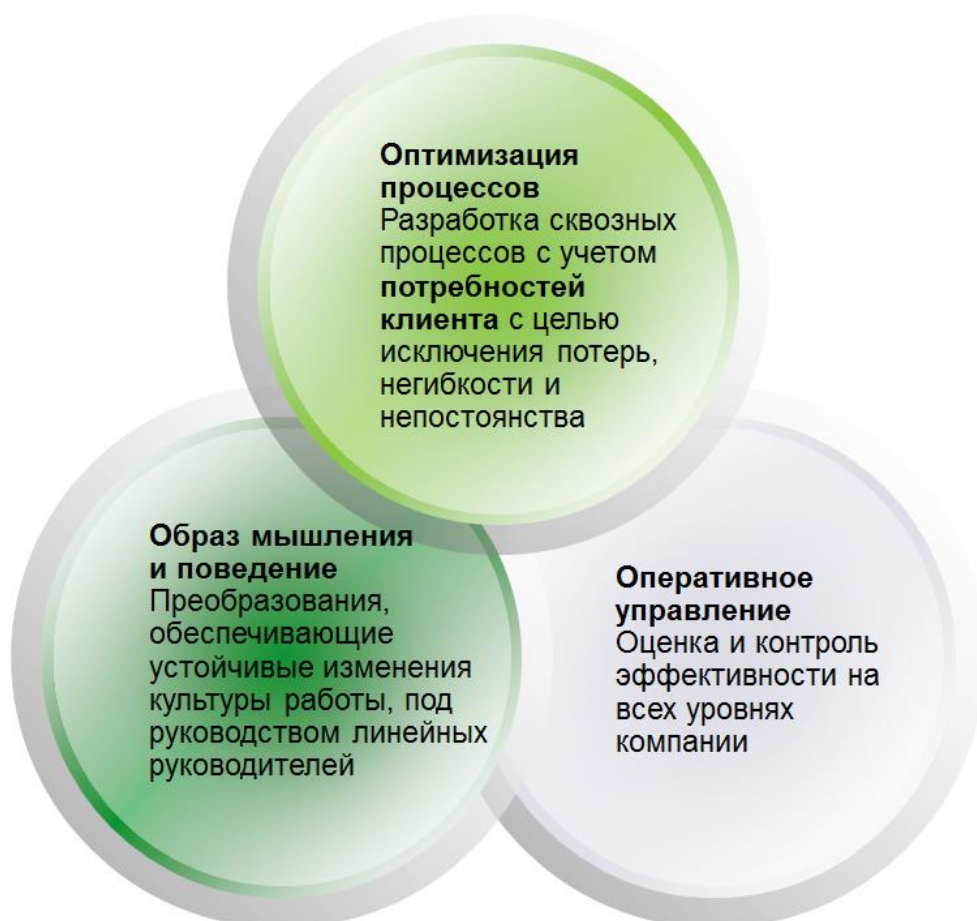
Рисунок 2. Три составляющих бережливого производства.

Бережливое производство является комплексным подходом, включающим оптимизацию процессов, обеспечение управленческой инфраструктуры и изменение образа мышления и поведения сотрудников (См. Рис. 2). Основными принципами бережливого производства являются принцип «точно вовремя» ( just-in-time ) с исключением всех видов потерь и принцип автономизации (autonomation) , или автоматического процесса преобразований с использованием интеллекта. Третий принцип известен как "дзидока", что означает «встраивание контроля качества» на всех уровнях компании.