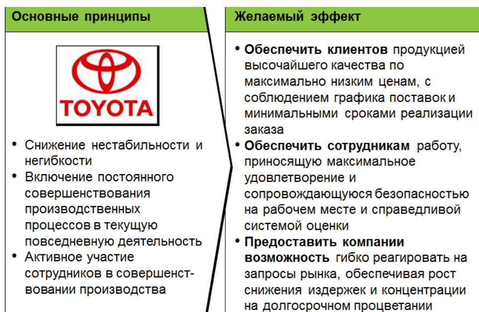
Рисунок 3. Производственная система компании Toyota.

В любой производственной системе, во всех процессах – от закупок материалов, производства продукта до продаж – существуют скрытые потери. И если все современные концепции организации производства говорят больше о «технократических» способах борьбы с потерями – например, более точном нормировании, отладке технологий, замене оборудования, т.е. отличаются своими акцентами, терминологией и степенью ориентации на те или иные аспекты менеджмента, то набирающая свою популярность концепция «бережливого производства» ставит во главу угла борьбу с потерями всех видов, при применении совершенно иной культуры организации и стиля менеджмента как среди высших, так и среди первичных уровней управления.