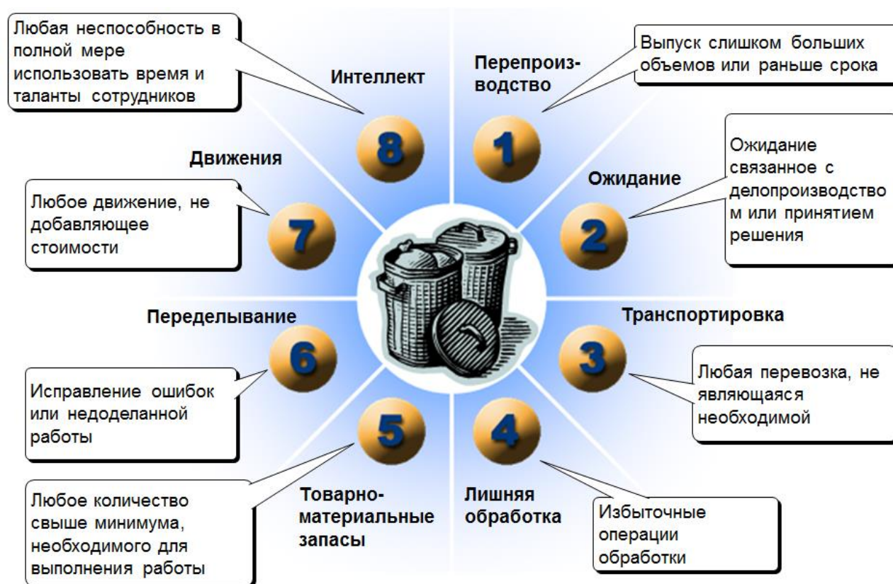
Рисунок 4. Основные виды потерь.

Классическим примером потерь служит производство упаковки для “Cola”: было подсчитано, что длительность потока создания ценности банки составляет чуть более 11 месяцев, из них хранение перед обработкой составляет 5 месяцев, после обработки – 6 месяцев, а само время обработки всего 3 часа. Получается, что более 99% всего времени поток создания ценности стоит на месте. При этом выделяют около 8 видов потерь (См. Рис. 4).